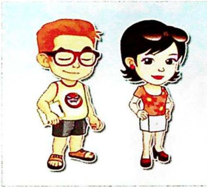
올바르지 않은 복장