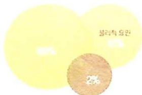
〈 사고 발생의 원인 〉